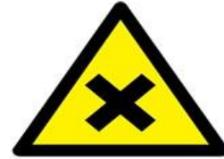
Zararlı veya tahriş edici madde