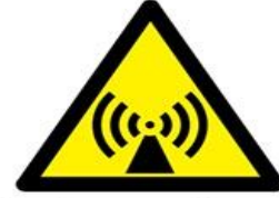
İyonlaştırıcı olmayan radyasyon