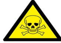
Toksik (Zehirli) madde